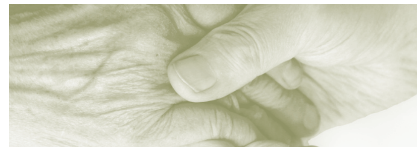
Layout & Satz: Franz Pietro/DigiComer, Graz 2020

Du gehörst dazu. Ich höre dir zu. Ich rede gut über dich. Ich gehe ein Stück mit dir. Ich teile mit dir. Ich besuche dich. Ich bete für dich.