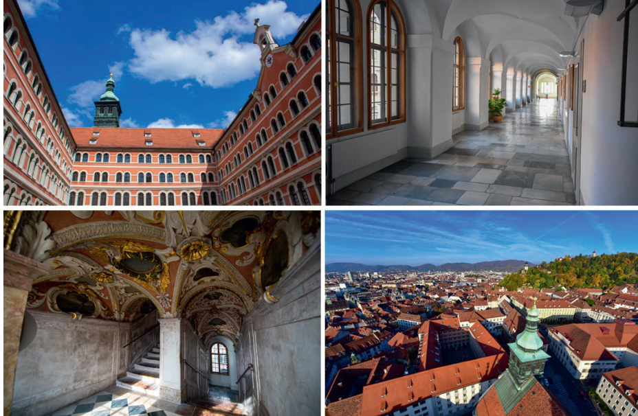
Priesterseminar Graz