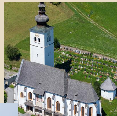
Pfarre Ranten