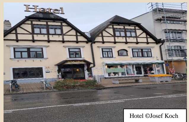
Hotel ©Josef Koch