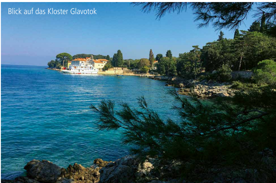
Blick auf das Kloster Glavotok