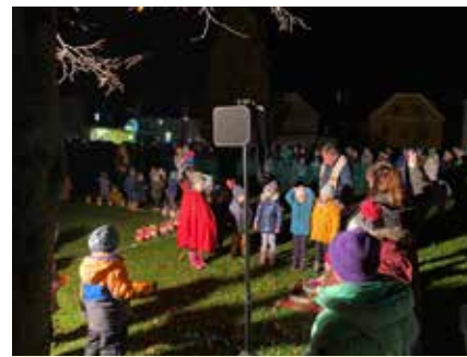
Laternenfest im Kindergarten