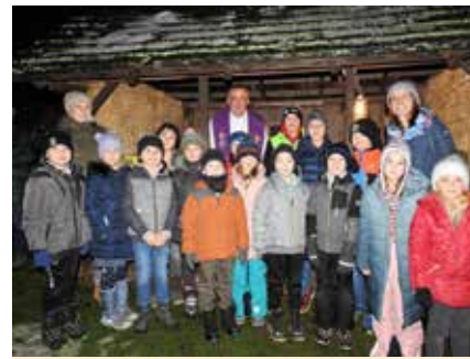
Frühroate in Mönichwald