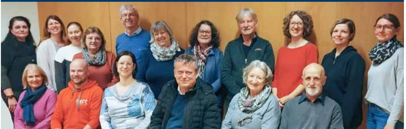
Pfarrgemeinderat Waldbach und Mönichwald

Wir hoffen, mit dieser Regelung möglichst vielen PfarrbewohnerInnen gerecht zu werden!