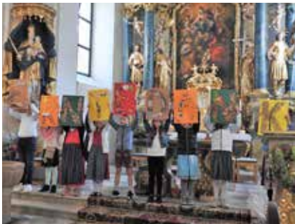
Erntedank mit den Kindern der VS