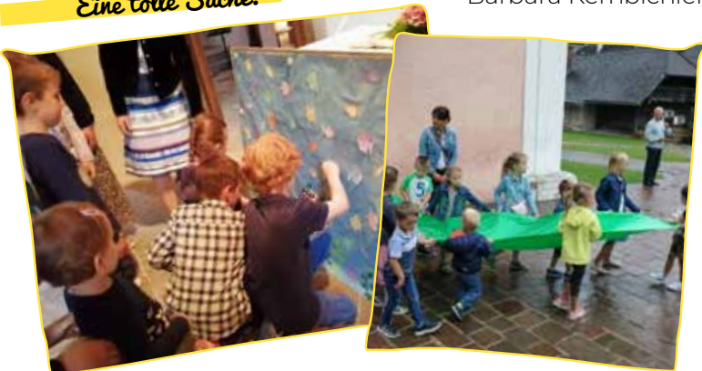
Ausschneiden und immer wieder daran erinnern!