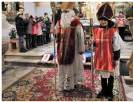
Nikolausfeier in Mönichwald