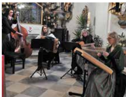
„Geschwister Höllerbauer“ am Stefanitag