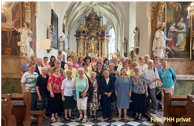
Gruppenfoto der Teilnehmer am Bildungstag in der Kirche Graz - Straßgang

„Mit allen Sinnen die Zärtlichkeit Gottes erleben“, so lautete das Thema der Bildungstage der Pfarrhaushälterinnen aus ganz Österreich.