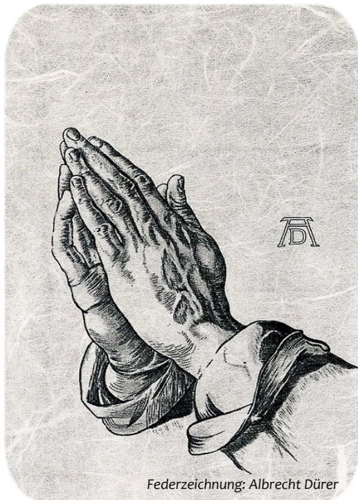
Federzeichnung: Albrecht Dürer