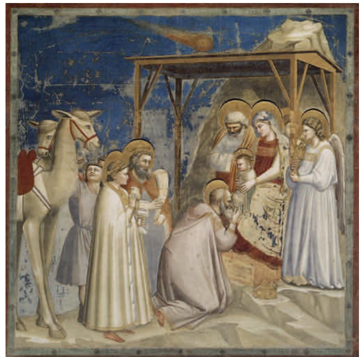
Giotto di Bondone. Szenen aus dem Leben Christi. Anbetung der Heiligen Drei Könige. Arenakapelle in Padua.