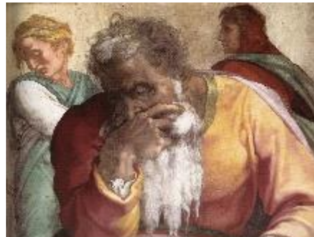
Prophet Jeremia: Detail des Fresko in der Sixtinischen Kapelle; Michelangelo (1511)

Lesung aus dem Buch Jeremia (Jer 20, 7–9)