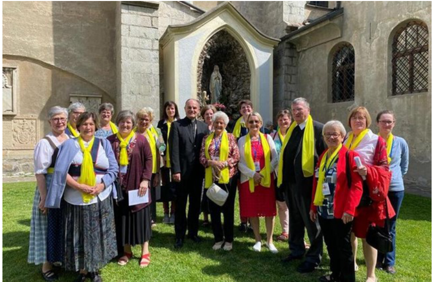
Die „Steirer“ mit Bischof Muser