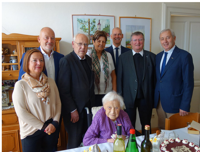
Frau Koschat mit ihren Gratulanten

Wir wünschen von Herzen Gottes Segen und Gesundheit